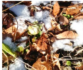
ハッケ (フキノトウ)