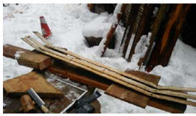
竹のスノーボード