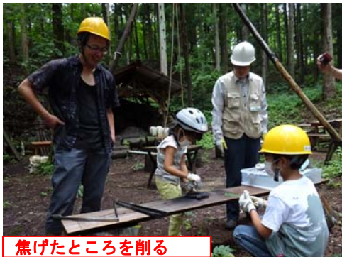
焦げたところを削る