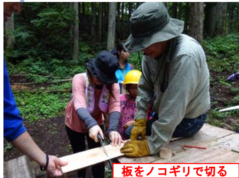
板をノコギリで切る