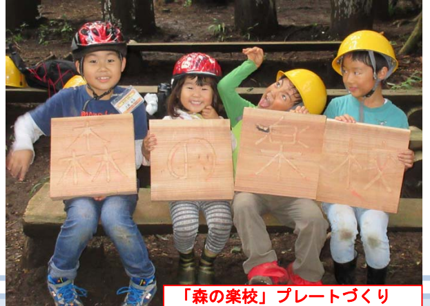
「森の楽校」プレートづくり