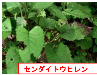
センダイトウヒレン