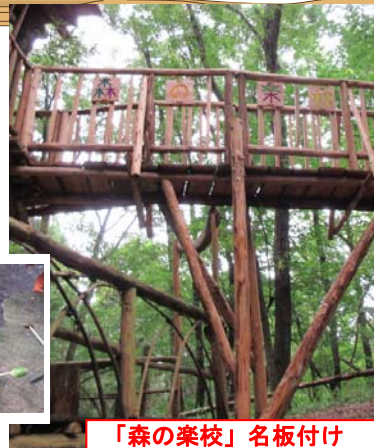
「森の楽校」名板付け