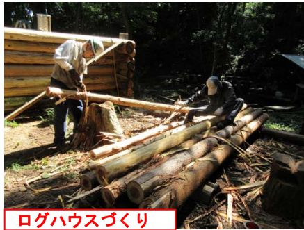
ログハウスづくり