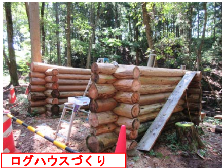
ログハウスづくり