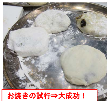
お焼きの試行⇒大成功!