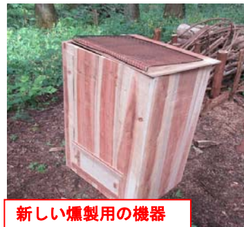
新しい燻製の機器