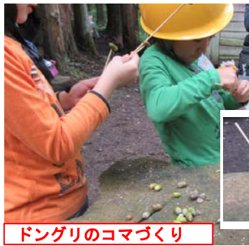
ドングリのコマづくり