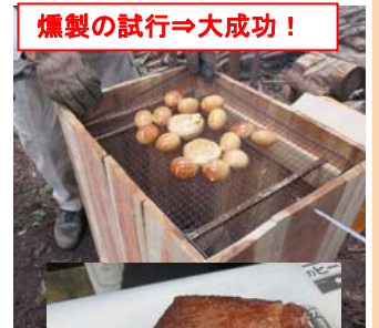
燻製の試行⇒大成功!