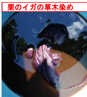
栗のイガの草木染め