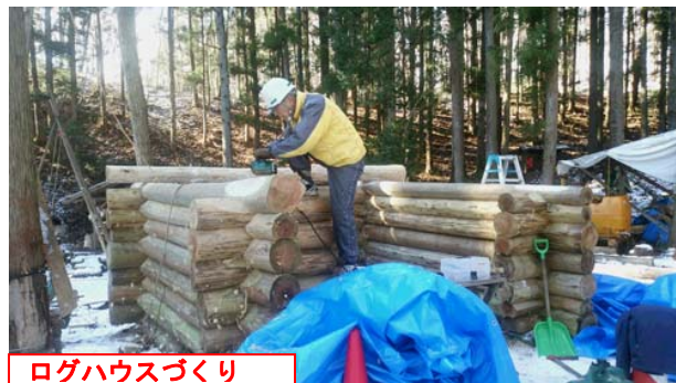
ログハウスづくり