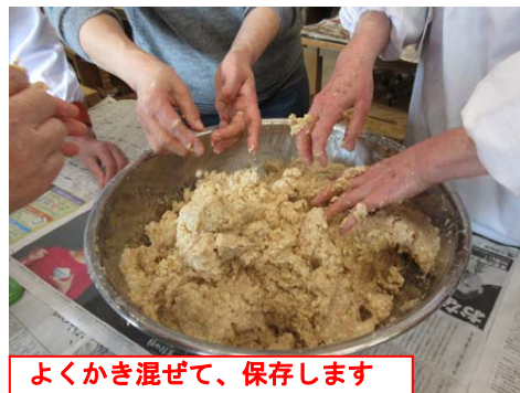
よくかき混ぜて、保存します