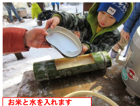
お米と水を入れます