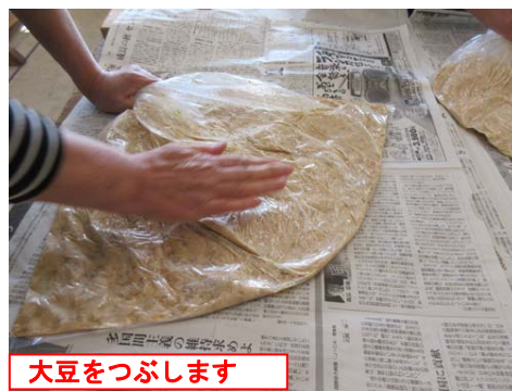
大豆をつぶします