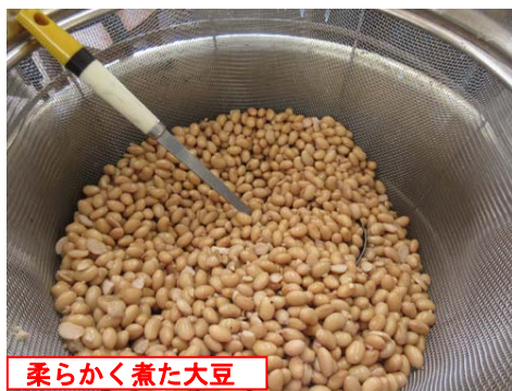
柔らかく煮た大豆