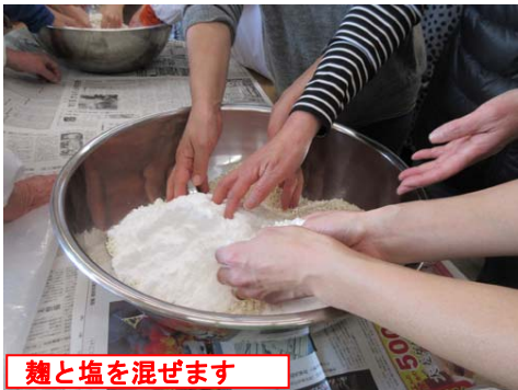
麴と塩を混ぜます