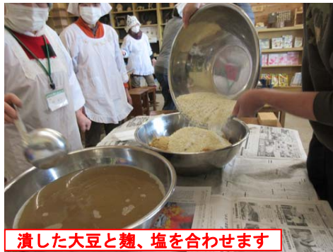
潰した大豆と麴、塩を合わせます