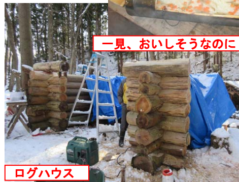
一見、おいしそうなのに!