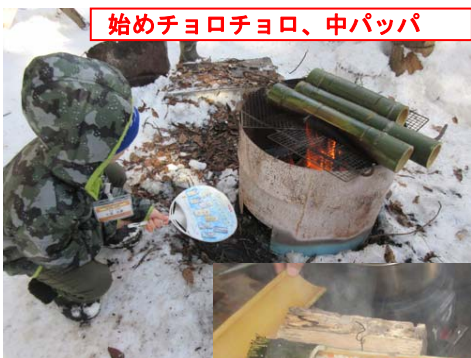
始めチヨロチヨロ、中パツパ